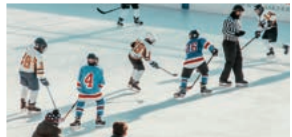
Neues erweitertes Eisfeld in Andermatt, New enlarged ice field in Andermatt, Nuova pista di ghiaccio ampliata ad Andermatt, Nouvelle patinoire élargie à Andermatt